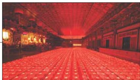
연등 자동장치 세를 중 한물이 준공된 모습 (불을 켜줄때의 전경)

찬덕연등에서는 KS케이블을 사용하여 가장 안전하게 전문 기술인에 의해 직접 감독 시공합니다. (원하시는 규격에 맞추어 직접 제작·시공 합니다)