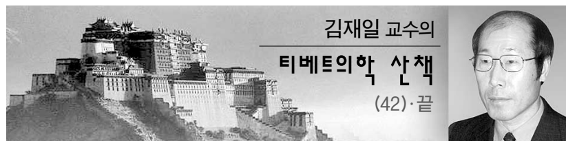
김재일 교수의 티베트의학 산책 (42)·끝