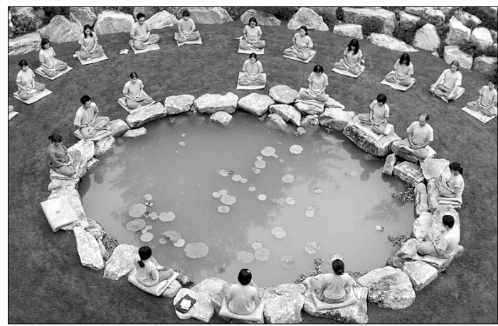
김상사 템플스테이에 참가한 불자들이 차담을 나누는 정경을 찍은 덕조 스님의 금상수상작.