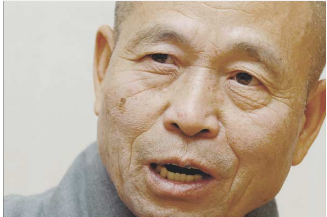
'통화불교'를 주창하는 각성 스님. 스님은 한 생각만 돌이키면 오락막세가 극력일 수 있으며 악을 버리고 선을 행하되 무주상으로 해야 한다고 강조했다.

한 번에 대박을 터뜨리기보다는 아주 조금씩 재물을 불려나간 것 또한 사업의 귀재도 아니고 종자들도 빈약한 사람이 성공할 수 있는 또 하나의 비결이 아닐까 생각합니다. 셋째, 그녀는 쉬지 않고 일을 하였다는 사실입니다. <불반나원경>에 "수십 명이 각각 활을 가지고 과녁을 향하여 화살을 쏘면 앞에 맞는 것도 있고 뒤에 맞는 것도 있지만 쉬지 않고 화살을 쏘면 반드시 과녁의 중앙을 맞듯듯이 게으르지 않고 끊임이 없으면 도를 증득할 것이다"라고 한 것처럼, 인젠가는 적중하리라 할 희망을 가지고 쉬지않고 화살을 쏘아댄 것이 부대찌개 식당 아줌마의 또 하나의 성공비결이라 할 것 같습니다. ■ 이미령(동국역경원 역경위원)