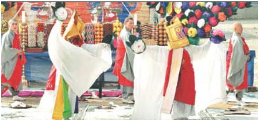
영산재의 네가지 작법 중 하나인 나비춤.

정하지 않아도 문화재보호법상 저촉되지 않는다는 해석도 덧붙였다. 단체의 사기 문제를 고려해 지금처럼 의식을 이끄는 보유자