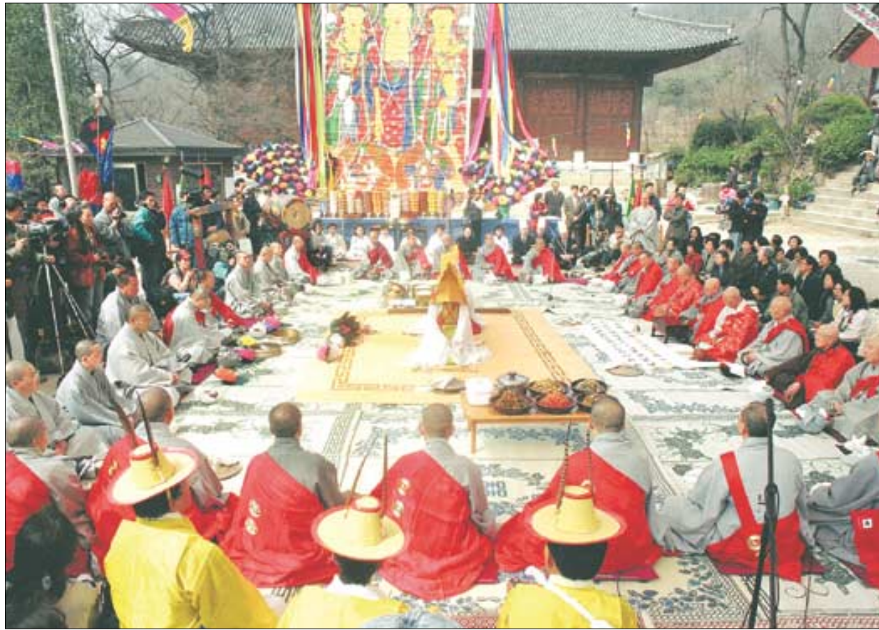
영산재의 여덟번째 단계인 '식당작법'에만 최소 20명의 전문가가 필요하다. 사진은 모든 영혼에게 부처님의 법식을 베푸는 '식당작법' 재현 모습.

더구나 이 같은 요구와 지적에 대해 문화재청이 '비효율적이고 무리'라는 입장을 보여 행정 편의적인 접근이라는 반응이다.