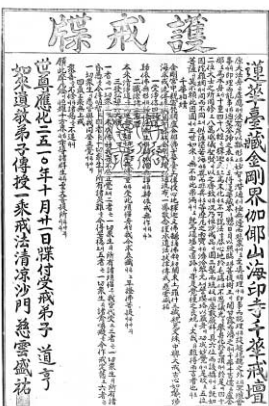
해인사 천화계단에서 자운을사가 사용한 호계첩문.

1700년에 걸쳐 면면히 이어진 한국불교 교단의 계승전통을 사료에 근거해 집대성한 저술이 나와 학계의 관심을 끌고 있다.