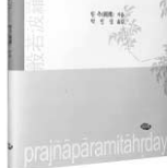
반야심경한 원측 지음 박인성 옮김 주민 | 1만5천원

“일반 불자들이 <반야심경>을 읽겠다는 것은 칸트의 <순수이성비판>을 읽겠다는 것과 다르지 않다고 생각합니다. <반야심경>에는 <반야심경>을 비롯한 모든 불교의 요체가 고스란히 담겨 있기 때문입니다.”