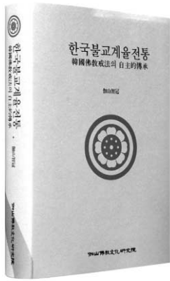
한국불교계법전통 지관 스님 지음 가산불교문화연구원 2만5천원