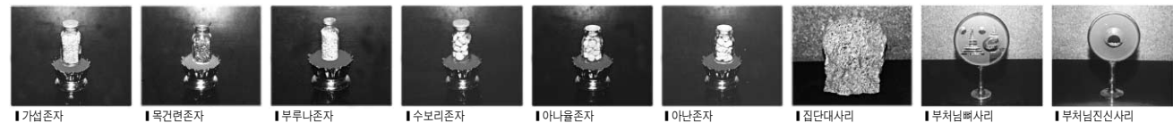
가피존자, 목간존자, 부처님존자, 수모리존자, 아나율존자, 아난존자, 정단사리, 부처님배사리, 부처님진신사리