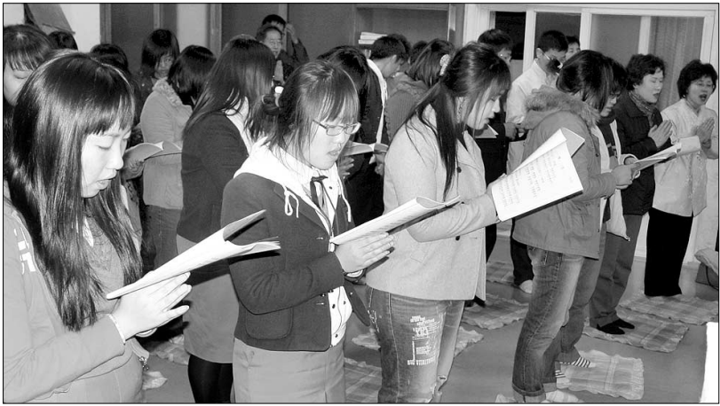
11월 19일 포항불교학생회 재창립 법회에 참석한 학생들이 반아침경을 봉독하고 있다.