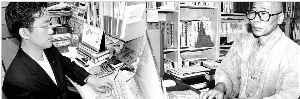
사이버 선 수행은 시·공을 초월해 선지식을 만나 수행점검을 받을 수 있는 장점이 있다. 사진은 일터에서 사이버 수행을 하고 있는 소비자보호원 변호회원 김중관씨(왼쪽)와 누리꾼 선택들에게 수행지도도를 해주고 있는 정목 스님(오른쪽)이다.