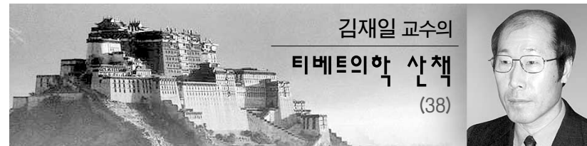
김재일 교수의 티베트의학 산책 (38)