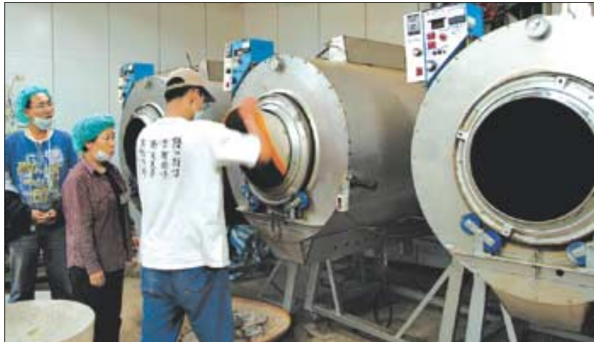
타이완 난토후 지역의 리산에 자리잡은 연합다원의 차 공장. 이곳은 품질경영시스템인 ISO 인증과 식품위생안전인증(ISO 22000)을 받아 차 생산과정 전반을 엄격하게 관리하고 있다.

세계적으로 유명한 타이완 오토차는 연간 2,200만 대가 생산되는데, 10% 정도만 타이완 국내에서 소비되고 나머지는 미국과 영국 독일 네덜란드 일본 등으로 수출되고 있다. 고품질의 차로 세계 차 시장을 주도하고 있는 타이완 차문화를 살피기 위해 가장 먼저 찾은 곳은 난토후(南投) 지역의 리산(梨山)이다. 최근 국내에도 적지 않은 양이 수입되고 있는 리산차는 고산지대에서 생산되는 차 특유의 향과 맛을 간직하고 있어 차인들의 다양한 입맛을 충족시키고 있다.