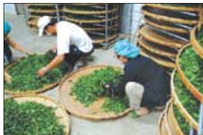
차의 안전성 확보는 세계 차 시장 진출의 초석이다.