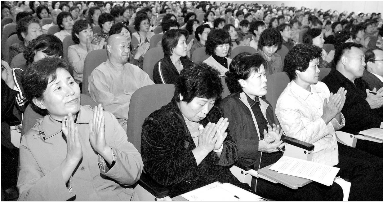
10월 26일 열린 빛고을 불교아카데미 네번째 법회에 참가한 불자들이 혜거 스님의 거침없는 법문에 아낌없는 박수를 보내고 있다.

이것은 수보리 존자가 젊었을 때 일이고, <중일 아함경>에서는 중년기 이후에 들어선 수보리 존자가 '무쟁삼매 제일(無諍三昧第一)'이라고 했습니다. <금강경> 제9장에서 '무쟁삼매 제일'이라는 대목이 나옵니다. 무쟁은 다투지 않는 것입니다.