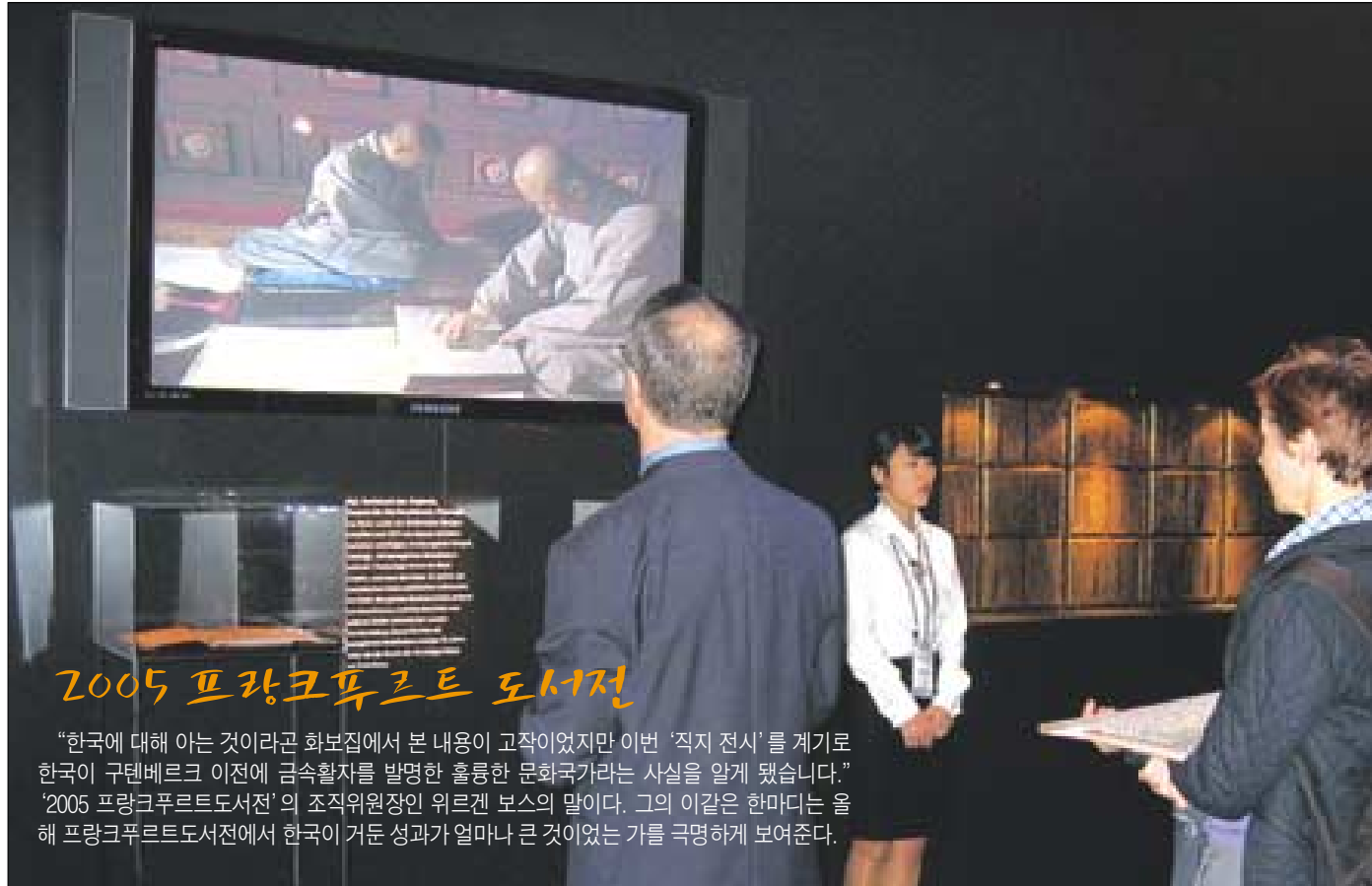
프랑크푸르트 도서전 주빈국관에 설치된 스크린에서 소개되는 스님들의 목판인쇄 과정을 관람객들이 신기한 관심있게 보고 있다.

세계 최대 도서전으로 한국이 주빈국관에 참여한 '2005 프랑크푸르트 도서전'이 10월 18일 개막식을 시작으로 19일부터 23일까지 5일간 프랑크푸르트시 메세장(박람회장)에서 성대히 진행됐다. 세계 101개국 7200여개사가 참여한 이번 행사는 총 28만명이 다녀가는 쾌거를 이뤘다. 특히 이번 도서전 공식 홈페이지(www.frankfurt-book-fair.com)는 주빈국 한국이 거둔 성과를 널리 홍보하고 있어 눈길을 끌고 있다. 개막식인 10월 18일 오후 2시 뢰머광장(Roemer Platz)에서는 한미음선원 독일지원장 혜진 스님과 신도 등 1백여명이 독일 전 언론에 팔만대장경과 템플스테이 등 한국 불교문화를 소개했다. 이어 오후 5시 독일 프랑크푸르트시 메세장(박람회장) 입구에 위치한 콩크레센트 하모니홀에서 열린 개막식에는 패트릭 로트 프랑크푸르트 시장, 이해찬 국무총리, 유르겐 보스 도서전 위원장, 노벨문학상 수상후보에 오른 고은 시인 등 1천5백여명이 참석했다. 고은 시인은 이 자리에서 한국을 손님으로 환영하며 "고은 시인은 이 자리에서 한국을 손님으로 환영하는 경지를 문화와 통해 체험하기를 바란다"고 전하기도 했다. 한국의 프랑크푸르트도서전 개막식도 같은날 오후 6시30분 메세장 포룸(포럼) 2층에 마련된 주빈국관에서 열렸다. 다음날인 19일 주빈국관 "U-book이란 모바일과 책의 만남입니다. 여러분들은 모바일 단말기를 이용해 원하는 책을 다운로드해 볼 수도 있고, 책 내용을 다른 사람과 주고받을 수 있으며, 전자책 형태로 독서를 할 수도 있습니다." U-book에 대한 설명과 함께 간단한 시연이 이루어지는 순간, 관람객들은 탄성을 내질렀다. 그리고는 다양한 질문들을 쏟아냈다. "어떻게 작