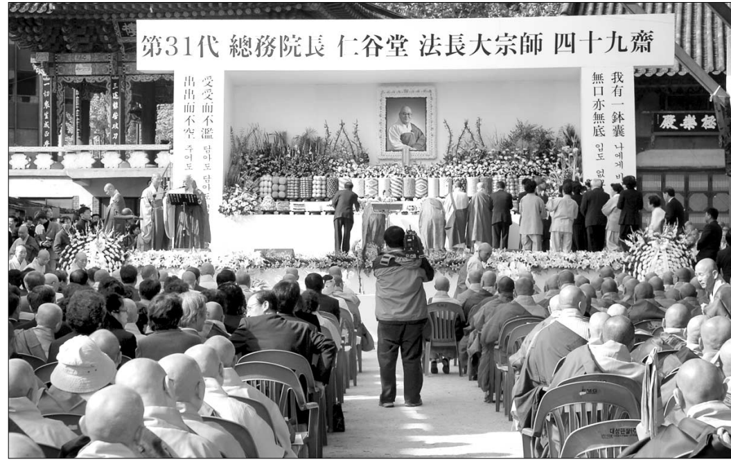
조계종 제31대 총무원장 법장 대종사의 49재가 10월 27일 조계사에서 2천여 사부대중이 참석한 가운데 열렸다.