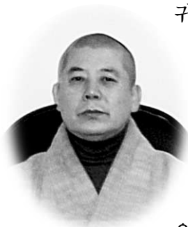
제13대 총무원장 해월스님