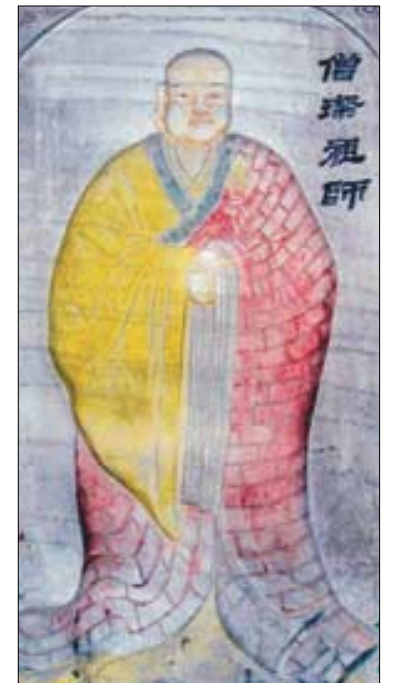
승찬 스님이 수행했다는삼조굴에 모셔져 있는 스님의 영정.

천주산 자락이 멀어졌다. 하지만 회미해지는 천주산 자락에서 나는 보았다. 승찬 스님이 섰던 대자유인이 되는 길이 거기에 나 있음을. 정리=한명우 기자