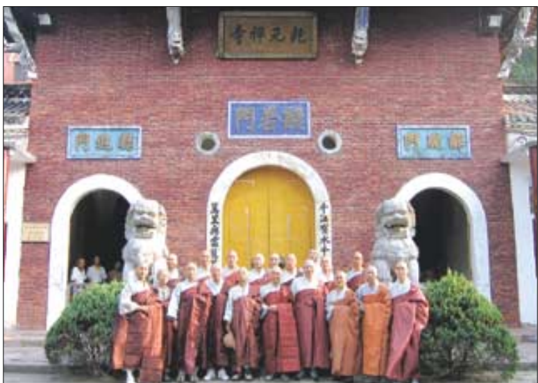
삼조사로 들어가는 첫 문 앞에서 선원장 스님들이 기념촬영을 했다.

삼조사의 원래 이름은 산곡사(山谷寺)다. 양무제가 양나라 고승인 보지(寶誌) 화상의 요청으로 이곳에 절을 짓고 산곡사라는 현판을 내렸다. 승찬 스님이 산곡사에 머물게 되는 것은 그로부터 100~150년이 지난 뒤다.