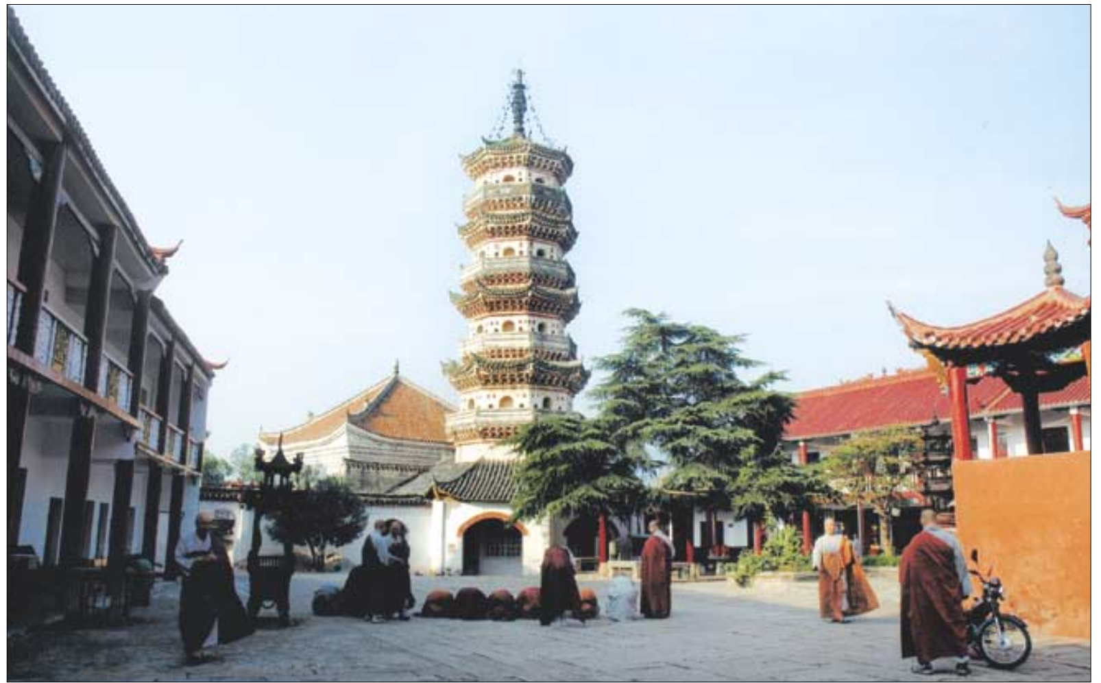
9월20일 삼조사를 방문한 조계종 선원장스님들이 3조 승찬 스님의 묘탑인 삼조탑 참배하고 있다