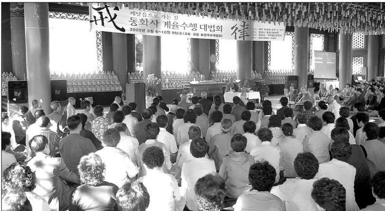
8월6일 입제해 10월9일 회향한 동화사 계율수행대법회는 계율의 의미, 지계의 중요성, 교육이 필요함을 확산시킨 대종법회였다.