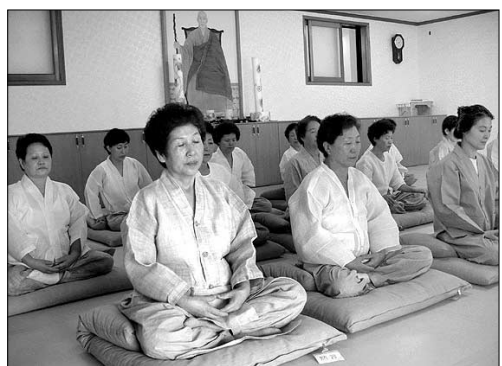
참선 정진중인 재가불자들. 전등선림 조실 해안 스님의 영정이 벽에 걸려있다.

전등선림에서는 동·하안거를 비롯해 24시간 선방의 문을 열어 개인별 자유수행이 이어진다. 하루 일과는 오전 8시부터 두 번의 공양 시간을 제외하고, 저녁 9시까지 교박 좌선 시간으로 진행된다. 특히 선림에서 상주하는 재가선객들은 새벽 3시 30분부터 저녁 9시까지 15시간 이상의 가행정진을 한다.