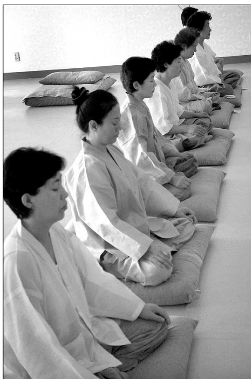
“7일 안에 깨쳐라!” 해안 스님의 선종을 쓰이며 서울 전등사 전등선림 재가선객들이 화두참선 정진을 하고 있다.

“과연 화두를 들고 있는지 아니면 겉으로만 ‘이렇고’ 하고 있는지, 어떻게 스스로 알 수 있을까요?” “화두를 들었다” 생각하면, 농철 때가 많아요. 의심을 늘 쟁기는 것이 중요해요. ‘이렇고’ 자체가 의심이죠. 그 의심이 끊어지지 않게 이어가야 해요.” “그 의심이란 어떤 것인가요?” “무엇이 부처입니까?” “.....” “바로 그것이 의심이죠. 자기도 모르는 것을 의심하는 것이 화두참구지요.”