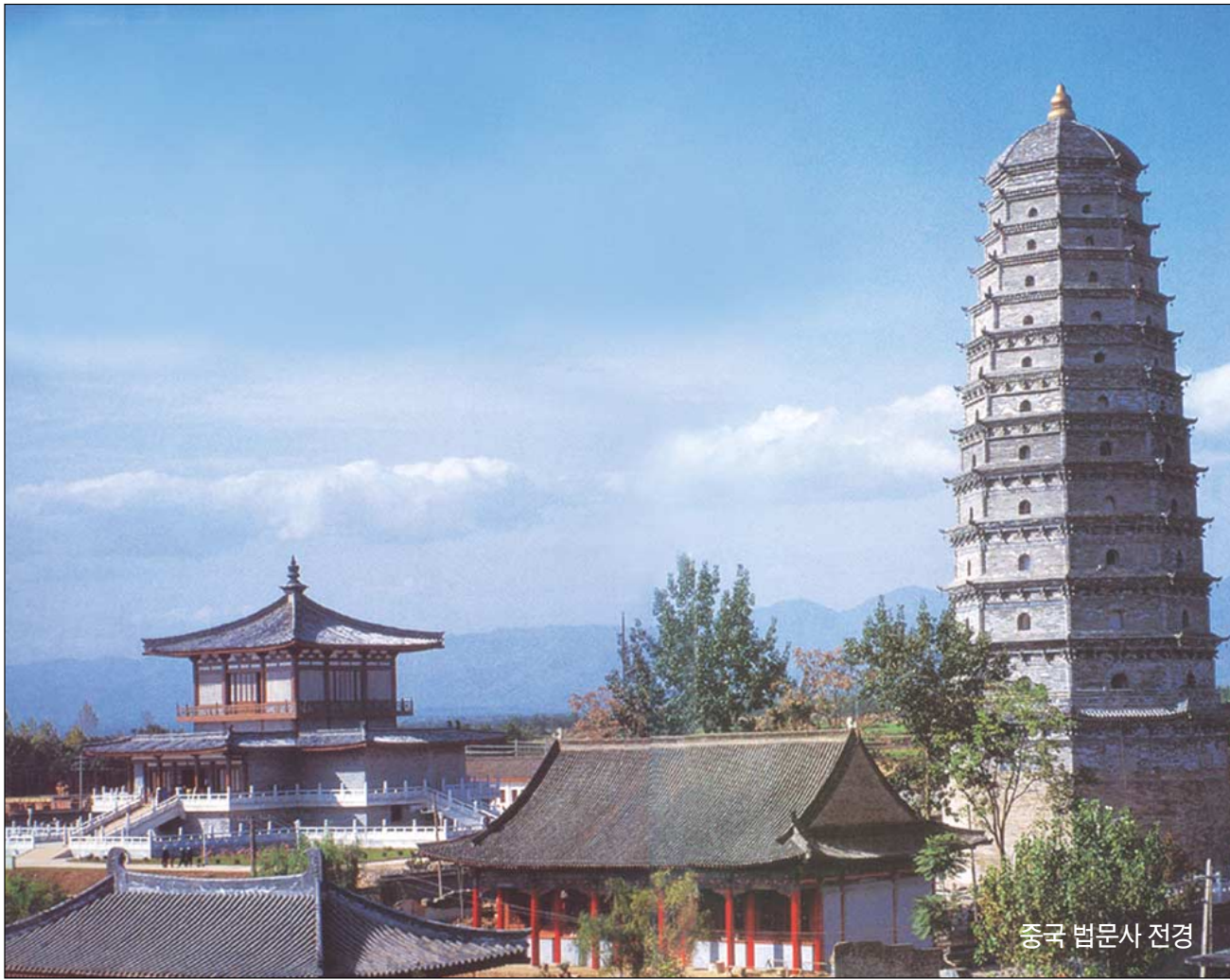
중국 법문사 전경