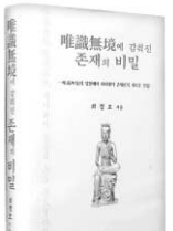
유식무경에 감춰진 존재의 비밀 최경호 지음 경서원 3만5천원