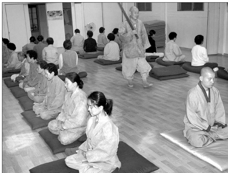
재가선객들이 10월1일 대구 동화사 비로암 보광시민선방에서 선원장 수련 스님의 지도로 토요일아침선정공양행사를 하고 있다.

대구 동화사 초입의 비로암. 범천(梵天)을 누빈 '용'이 파리를 틀고 있었다. 세수 아흔 둘의 조계종 명예원로의원 범룡(梵龍) 스님은 '문' 없는 조실 방문을 열고, '말' 없이 말했다. "이 놈들, 이 놈들!" 토요일아침선정전에 들어간 재가선객들의 머리털이 쭈뼛 섰다. 천리만리 도망간 화두를 다시 붙잡아 들었다.