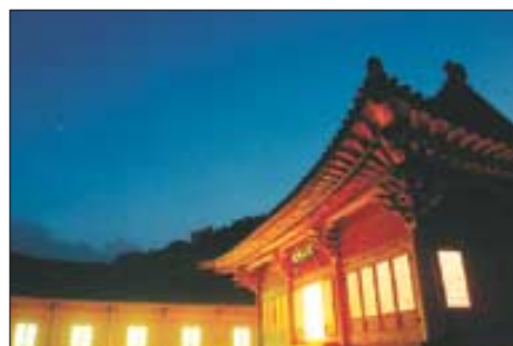
불을 밝힌 진전사 대웅전과 요사채.

붉게 물든 산하(山河)가 행락객들을 유혹하는 가을이다. 화려한 수목들과 대화하며 산에 오르는 것은 가을에만 만끽할 수 있는 특권. 물론 시기와 장소를 잘 선택한다면 그 즐거움은 배가될 것이다. 그런데 여기 한 가지 특권을 더 누릴 수 있는 곳이 있다. 바로 설악산 진전사다. 진전사는 설악산에서 승용차로 불과 15분여 거리에 위치해 있어 가을 산을 보고 사찰도 참배할 수 있는 몇 안 되는 명소다.