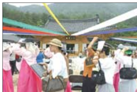
지난 6월 열린 진전사 복원 낙성식에서 불자들이 기와를 봉정하고 있다.