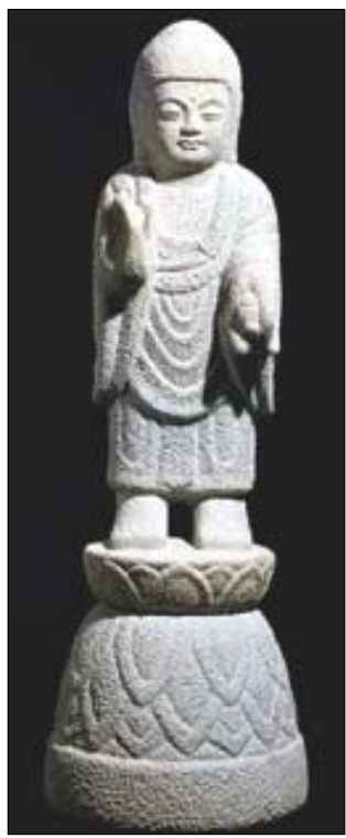
동글동글 동자의 얼굴을 아자지하게 표현한 이재순 작 '동불'.