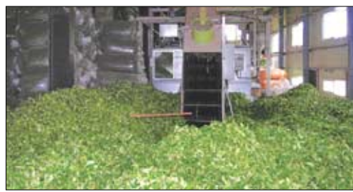
기계로 수확한 차잎은 자동화 기계를 통해 티백제품으로 만들어진다.