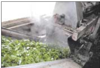
컨베이어 벨트로 다음 단계로 옮겨진다.