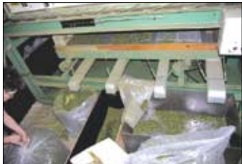
건조된 차잎을 크기별로 선별한다.