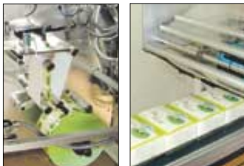
티백에 담겨 제품으로 포장된다.