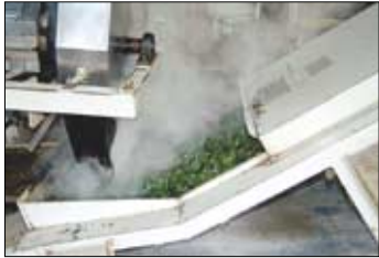
효소 작용을 억제시키는 살청과정.