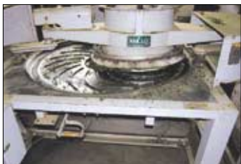
차잎의 모양을 만드는 유념.