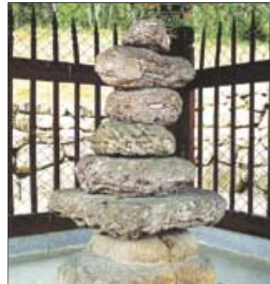
대표적인 가야문화재 '파사석탑'.

아울러 풍성한 공연이 준비돼 있다. 각종 퍼포먼스와 콘서트, 마당극 등 전통과 현대를 아우르는 공연들이 즐비한 것. 여기에 세계전통문화의 장도 함께 열려 중국, 몽골, 일본 등 가까운 나라에서부터 멕시코