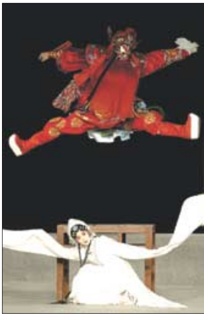
중국 소주 공연단의 공연 모습.