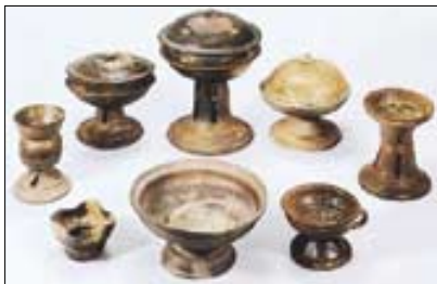
가야 고분군에서 출토된 가야토기들.