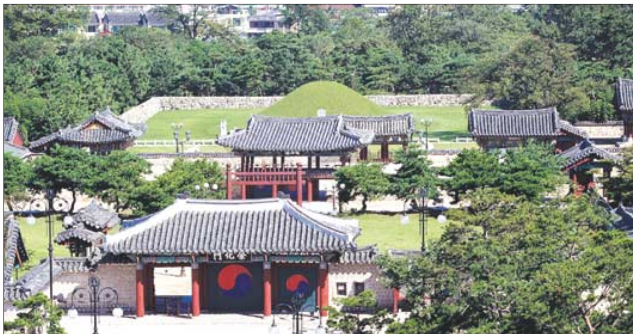
김해를 대표하는 수로왕릉. 가야의 흔적이 고스란히 묻어나는 까닭에 찾는 이들의 발길이 끊이지 않는다. 수로왕릉은 '가야세계문화축전 2005. 김해'의 열풍이기도 하다.