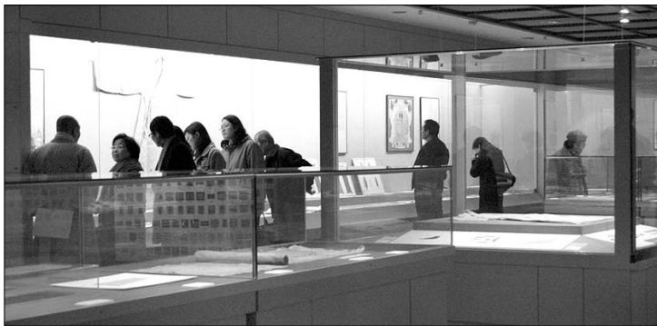
월간미술대상 전시기획부문 장려상을 수상한 수덕사근역성보관의 '지심귀명례-한국의 불복장 특별전' 전시실. 이 기획전은 2004년 10월 11일~11월 10일 열렸다.

보관해두는 '창고' 역할에서 벗어나지 못하는 상황에서 이들 몇몇 사찰박물관이 일반 국공립박물관과 대등한 수준으로 자리잡을 수 있었던 비결은 무엇일까. 전문가들은 이들 사찰박물관의 성공비결을 특화전략과 관장 및 학예사의 열정에 있다고 본다. 통도사성보박물관 하면 불화가, 지지성보박물관 하면 금석문이다. 수덕사근역성보관 하면 직물·의류가 떠오르는 것은 이들 박물관이 특화된 성공했음을 뜻한다. 대원사티벳박물관이나 명주사고려화박물관은 각각 인도세밀화와 고려화라고 하는 특화된 콘셉트를 보유하고 있어 이 분야 독보적인 박물관으로 이미지를 굳