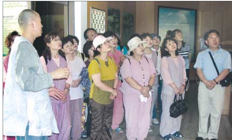
김포 용화사 불교대학 수료자들이 지난 6월 성지순례차 방문한 화성 용주사 효행박물관에서 설명을 듣고 있다.

김포불교가 침체를 벗고 궤도에 오르기 위해서는 사찰들 간의 불협화음을 해결하는 것이 시급하다. 현재 김포불교는 사암연합회와 승가협의회로 양분돼 있는 상태. 더욱 심각한 것은, 현재와 같은 상황으로는 계속해 규모가 커지며 발전하고 있는 도시의 금정승가대는 달리 불교는 퇴보할 수밖에 없다는 점이다.