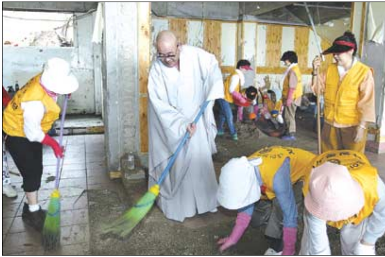
수해 지역을 방문한 법장 스님이 직접 비질을 하고 있다.