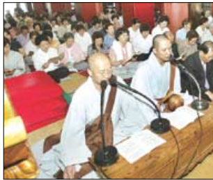
빈소가 마련된 조계사 법당에서 독경하는 불자들.