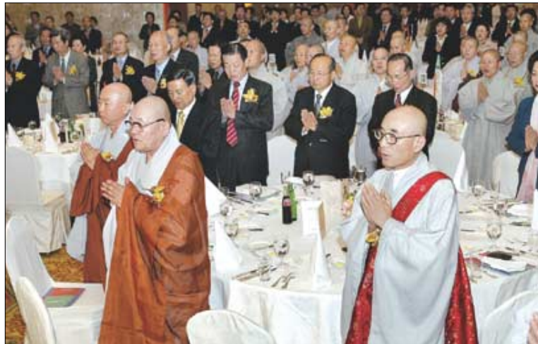
법장 스님은, 인식이 아직 생소했던 10여년전 불교계 장기기증본부인 '생명나눔실천회'를 창립, 이타행에 앞장섰다. 사진은 2004년 3월31일 롯데호텔에서 거행된 (사)생명나눔실천본부 창립 10주년 법회에 참석한 법장 스님(앞줄 왼쪽).

9월 11일 열반에 든 조계종 총무원장 법장 스님은 역대 총무원장 가운데서 가장 활발하게 사회활동을 했다.