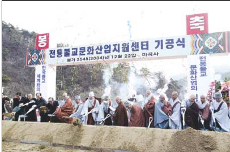
2004년 12월 착공식을 거행한 '전통불교문화산업지원센터'. 스님이 총무원장 당선 이후 가짐을 쏟았던 불사다.

소년소녀가장 돕기 1사찰 1가정 결연 후원 운동을 전개할 때다. 중앙총무기부 부실장과 국장들이 종로구청 내 소년소녀가장과 결연할 때, 스님은 당시년부터 결연한 소년소녀가장에게 대학 진학 시까지 장학금 지원을 약속했다. ‘말’ 보다 ‘실천’이 중요