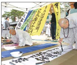
조문 온 스님들이 민장을 쓰고 있다.

비와 자애로 포용하셨다"고 애도했다. 한국 천주교 주교회의도 11일 "불교의 발전과 종교간 화합에 크나큰 기여를 하신 스님께서 우리 곁을 떠나신 데 대하여 많은 불자들이 슬픔을 함께한다"며 "법장 스님께서 보여주시는 화합과 일치 정신이 우리 안에 계속 이어져 나가기를 바란다"고 밝혔다. 대만 불광산 종위원회도 12일 "큰스님의 높고도 높은 기개와 엄격하고 근엄한 수행정신, 넓고도 모범적인 사람됨, 보살의 깨끗한 실천, 불교계가 모두 존경했다"고 애도했다. 남동우 기자