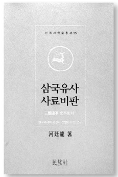
삼국유사 사료비판 하정웅 지음 민족사 | 2만원