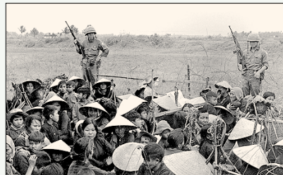
베트남 난민들이 한국군의 감시를 받으며 성문 분류를 기다리는 모습.