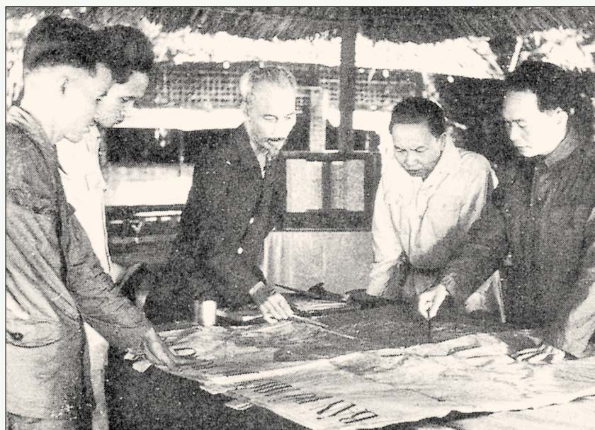
호찌민(사진 왼쪽에서 세번째)과 보응웬 지압(맨왼쪽) 장군이 '디엔비엔푸' 전투중 작전회의를 하고 있다.

호찌민은 46년 프랑스군에 선전포고를 한다. 이후 54년 베트남(越盟, 베트남은 호찌민이 독립을 선언하며 조직한 북베트남의 정규군이고 우리가 알고 있는 '베트콩'은 남부 베트남에서 활약하던 공산주의자들)이 군은 베트남 중부 디엔비엔 계곡에서 프랑스군 12개대대를 격파, 프랑스군을 남쪽으로