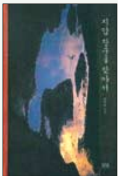
지압 장군을 찾아서 안정효 지음 들림 퍼냄 | 1만8천원

새로운 전쟁문학이라는 호평을 받은 <하얀 전쟁> <은마는 오지 않는다>로 우리의 기억에 인상깊은 작품을 발표했던 안정효. 그가 이번에는 전쟁과 인간이라는 진지한 주제로 <지압 장군을 찾아서>를 내놓았다. 이 책은 작가 안정효가 2002년, 한국과 베트남 수교 10주년을 맞아, KBS-TV <일오스페셜> 제작진과 함께 베트남을 찾아가 호치민(사이공)에서부터 하노이까지 '통일열차'로 종단하는 시점에서 출발한다. 하지만 이 책 속에는 집필 당시인 2005년의 사건까지 언급하고 있다. 그 이유는 계속해서 진행되는 역사적인 사건들, 예를 들어 미국의 이라크 침공과 한국군 파병과 같은 중대한 문제를 시간 제약 때문에 억지로 무시해서는 안 되겠다는 지은이의 강한 의지 때문이다.