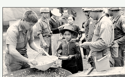
C-레이션 광풍을 받기위해 난민들이 줄지어 기다리고 있다.

의 용병이 돼 받는 하루 1달러에 목숨 걸었던 우리 군인들의 모습과 그들이 베트남 민간인을 잔혹하게 죽여야만 했던 비극적인 사실도 여과없이 보여준다.