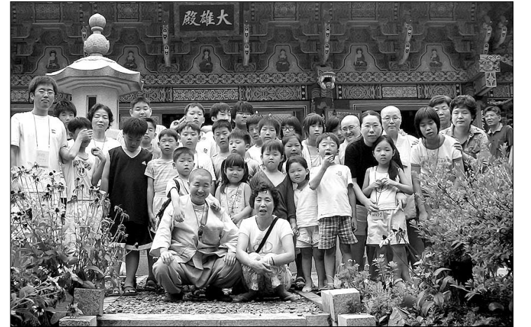
하남 상불사는 미래불자 양성을 위해 어린이·청소년 포교에 힘쓰고 있다. 사진은 7월 30일~8월 1일 해남 진학사에서 열린 '야단법석' 수련회 때 모습.