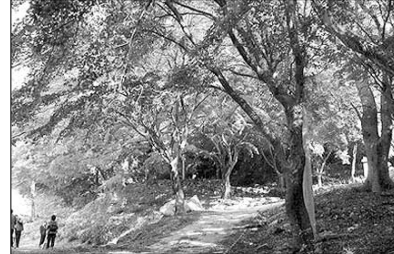
문수사 진입로의 단풍나무 군락.

고창 문수사(주지 선범) 진입로에 자생하는 단풍나무 500여 그루가 지난 9월 8일 국가지정문화재인 천연기념물 제463호로 지정됐다. 단풍나무숲으로는 국내 최초 문화재가 된 문수사 진입로 단풍나무는 직경 30~80cm, 높이 10~15m, 나무둘레 2~2.95m 크기로 수령 100~400년의 노거수가 군락(20필지 12만65㎡)을 이루고 있다.