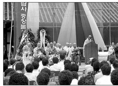
금탑사 중창불사 회향법회에 300여명의 사부대중이 동참했다.