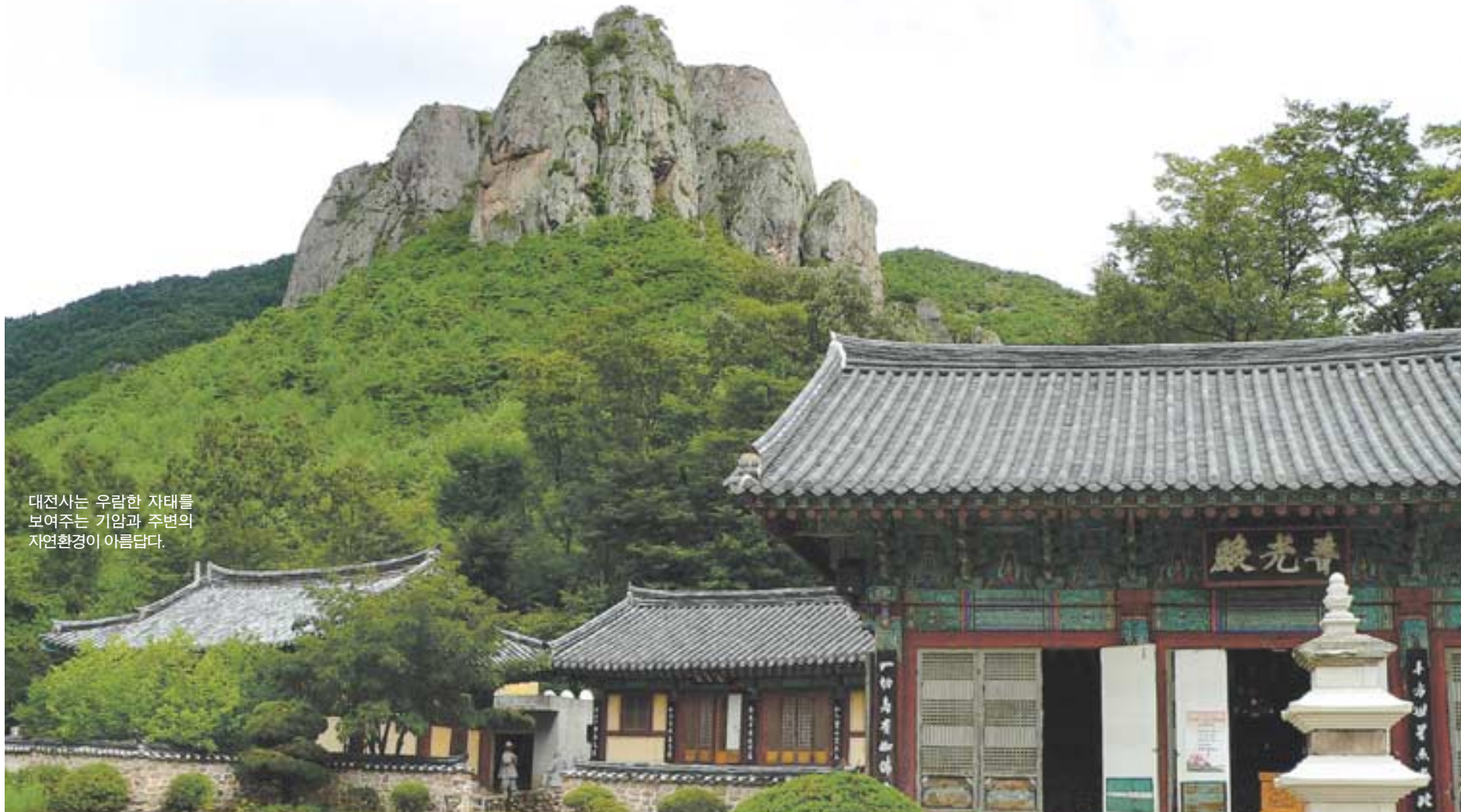
대전사는 우람한 자태를 보여주는 기암과 주변의 자연환경이 아름답다.

숲길과 함께 하는 주방계곡은 주방천의 상류로, 갈겨니가 우점종으로 서식하고 있다. 갈겨니에 비해 몸집이 작은 버들치는 얕은 계류에서 관찰된다. 대전사를 지나면 강폭이 넓어지면서 물고기의 종류가 다양하게 나타난다. 몇 해 전에 나온 보고서에 따르면, 주방천에 서식하고 있는 물고기가 약 27종이라고 한다. 그 가운데 자가사리는 환경부에 의해 보호종으로 분류되어 있다. 한편 주방천은 새들의 무대이기도 하다. 호반새, 물까마귀, 물총새, 큰우리새 등이 대전사 주변 주방계곡에서 관찰된다. 여름 땀금류로는 붉은배새매, 소쩍새, 새매, 수리부엉이, 솔부엉이 등이 서식하고 있다. 팔각정에 이르면 오른쪽 계곡 건너 주왕암으로 가는 길이 나 있다. 주왕암은 대전사 '큰 절'에 견주어 '안 절'이라는 별칭을 갖고 있다. 주왕암 약수는 물을 마시면 지혜로워진다는 '홍명수'로 소문이 나 있으나, 주왕굴로 올라가는 철제 사다리가 약수터 위로 지나가고 있어서 등산객들의 신발 등으로부터 흙과 이물질 등이 떨어져 약수로 스며들 위험도 높고, 장마철이 되면 지표수가 그대로 흘러들어가게 되어 있다. 게다가 관리가 부실하여 여름철에는 벌레들이 들어갈 위험도 높다. 수시로 수질을 점검할 필요가 있다. 주왕암 앞 숲길로 생태탐방로가 이어진다. 주왕산은 전체적으로 소나무와 활엽수가 분포하고 있다. 주왕산은 산의 경사면에 따라서 소나무림과 활엽수림의 분포가 확연한 차이를 보이고 있어서 전형적인 식생대의 천이과정을 잘 보여주고 있다. 연화봉, 병풍바위, 학소대, 급수대, 시루무 등 어슬렁어슬렁 활곡은 기암절벽들이 노출되어 있어서 암곡식생의 다양성을 잘 보여준다. 바위 절벽에 꼭대기 하듯이 붙어서 자라는 부처손은 암곡식생의 대표적 식물이다. 부처손은 망개나무와 둥근잎평의비름꽃과 함께 주왕산의 환경지표종이다. 편백림과 흡사한 부처손의 잎은 부채살처럼 퍼져서 자란다. 상록성 여러해살이 양치식물이라 습도에 민감하다. 물기가 공급되지 않거나 공기 중 습도가 낮으면 흡사 아이들 주먹처럼 잎이 안쪽으로 둥글게 말린다. 그러다가 비라도 내리면 습도가 올라가면 다시 새파랗게 되살아난다.