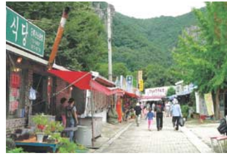
음식점, 숙박 시설로 가득한 대전사 진입로