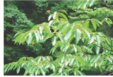
천연기념물 제270호로 지정된 망개나무