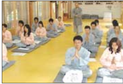
템플스테이 둘째날 진행된 '감사명상'. 세상 모든 것에 감사하는 합장을 하고 있다.