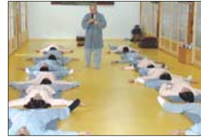
프로그램 진행에 앞서 몸과 마음을 쉬는 템플스테이 참가자들.