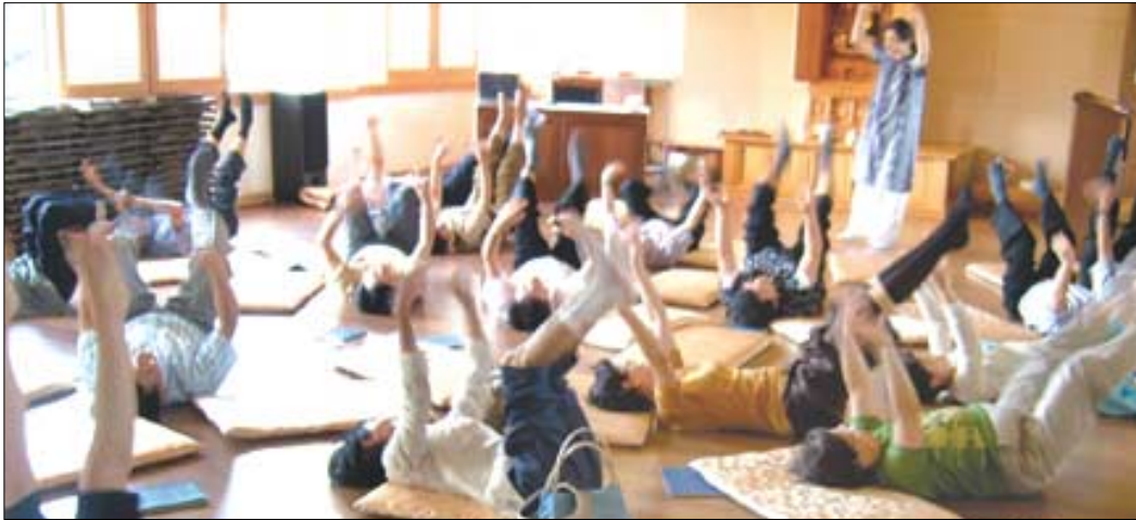
(사)우리는선우의 '빛깔있는 법회'와 서울 봉은사의 '주제가 있는 성지순례'가 차별성 있는 프로그램으로 떠오르고 있다. 사진은 우리는선우의 요가법회 모습.

(사)우리는선우의 '빛깔 있는 법회'와 서울 삼성동 봉은사의 '주제가 있는 성지순례'가 '뭔가 다른' 법회와 순례를 원하는 불자들의 갈증을 풀어주는 프로그램으로 떠오르고 있다.