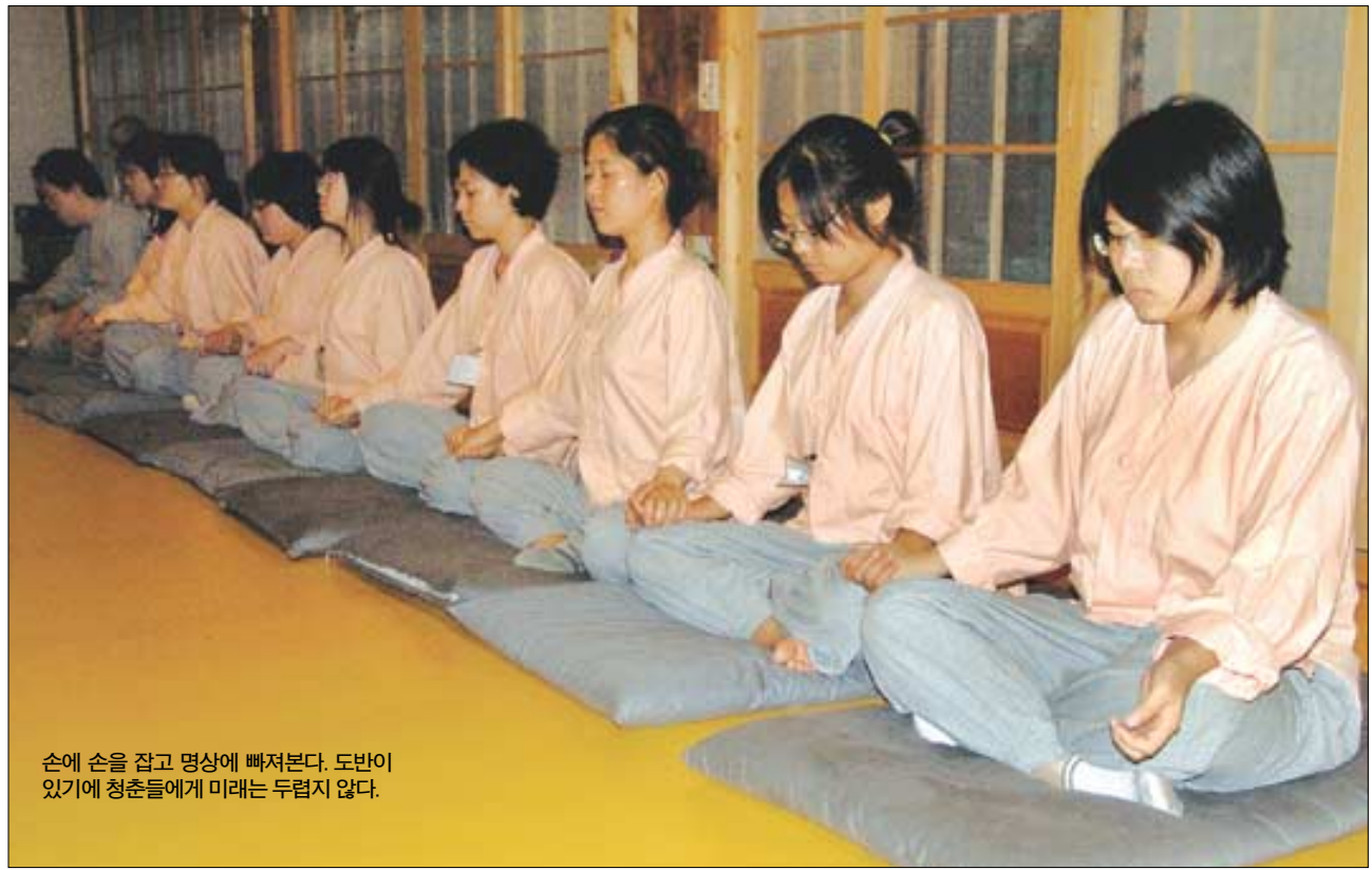
손에 손을 잡고 명상에 빠져본다. 도반이 있기에 청춘들에게 미래는 두렵지 않다.