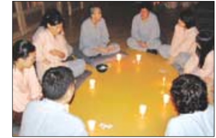
참가자들이 더 넓은 세상을 향해 달려갈 것을 다짐하고 있다.