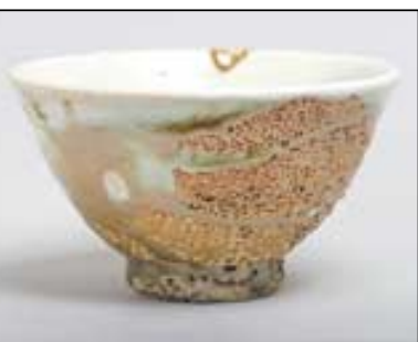
신현철씨의 '작은 찻사발'