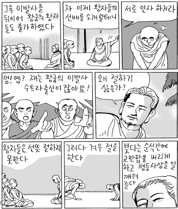
우바리존자(?-?): 석가모니 십대제자 중 한 사람, 석가족 궁정의 이발사 출신으로 교단계열에 통합하고 계율을 잘 지켜 지계제일로 꼽힘.