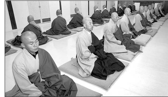
선수행은 스스로의 깨달음이 강조되어 '자력'의 입장으로 인식되고 있다.

<무량수경> 대중강의를 하고 있는 호란 스님(연천 오봉사)은 "아니다"라고 단언한다. 스님은 아예 염불은 '불력(佛力)'이라고 강조한다. 스님은 "염불은 중생이 부처님을 생각하는 것이 아니라 부처님이 중생을 생각해 구제하는 마음이다. 염불은 내가 하고 싶어서가 아니라 부처님이 중생들을 구제하겠다는 수행이기 때문"이라며 "한국불교에서는 이를 '선정일치(禪淨一致)'라고 강조해 염불과 선이 같다"고 설명한다. 반면 염불수행이 타력이라고 주장하는 입장도 있다. 강동균