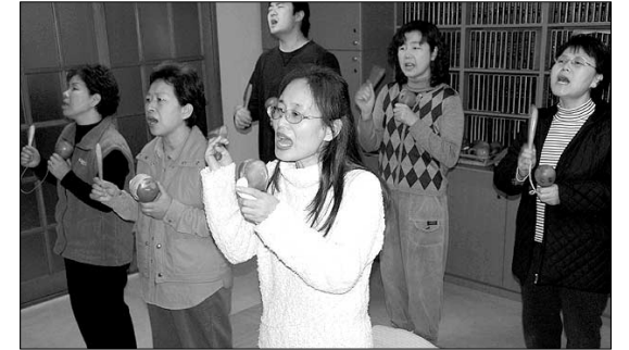
염불수행은 아미타불의 본원력에 의지한다는 면에서 타력의 성격이 짙다.

자력도 타력도 있을 수 없다"며 "자·타력의 양 극단으로 나눠 인식하는 것은 수행의 '포용성'을 그르쳐 결국 깨달음을 얻을 수 없게 한다"고 강조한다.