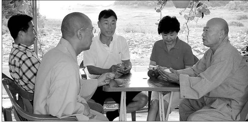
연꽃마을 주지 도공 스님(맨 오른쪽)이 연꽃마을을 찾은 스님, 불자들과 대화를 나누고 있다.

호수 위로 해발고도 200~300m의 야산과 수목이 펼쳐져 드라이브 코스로 잘 알려져 있는 대청호. 철새와 뒷새가 많이 날아들고 전망대에 오르면 주변 경관이 한눈에 내려다보이는 곳. 한 가지 흠이라면 마땅히 쉬어갈 곳이 없다는 것.