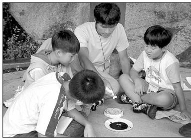
탁본시간 먹물을 조심스럽게 묻혀 무늬를 찍어내며 아이들이 전통 문화의 멋스러움을 체험했다.

평소 같으면 인터넷을 볼때고 게임과 씨름 하고 있을 주말, 승채(금양초 6)는 법어사 금강암(주지 정만)에 올랐다. 20, 21일 이틀 동안 금강암에서 열리는 초등학생 산사체험에 참여하기 위해서다. 금정청소년수련관(관장 정만)이 마련한 이번 초등학생 산사체험은 불교계가 운영하는 청소년수련관 중 처음으로 청소년들