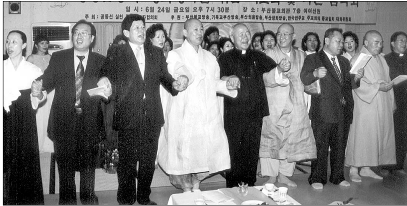
지난 6월에 열린 세계평화 기원 음악회에서 6대 종교 지도자들이 손을 맞잡고 함께 노래하고 있다.