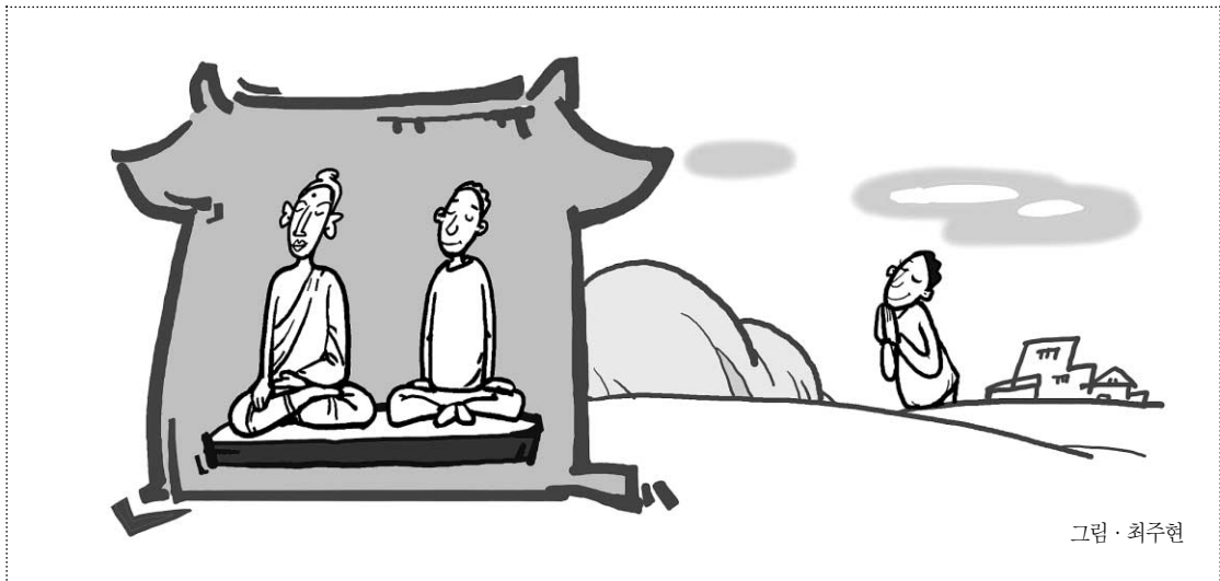
그림 · 최주원

런데 나무들로 봐서는 흩어 가린 거죠. 흩어 가려 서 자기 뿌리를 자기가 못 봐서 자기 뿌리라고 연 관이 없게 되는 거죠.