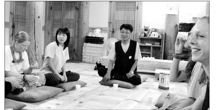
국제교류 자원봉사 프로그램에 참가한 외국인인들이 통해 삼화사에서 템플스테이를 하고 있다.