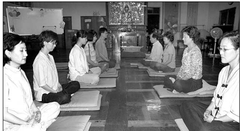
참선 정진 하고 있는 직지 선방의 재가불자들.

#경계를 만나면 경계를 바로 본다 그럼, 직지선방에서 수행하는 재가선객들은 어떤 자기변화를 경험했을까?