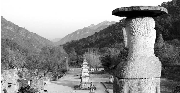
웅장한 법당과 분주한 사람들의 발길은 사라졌지만, 문화재들은 여전히 그 자리에서 폐사지를 지키고 있다. 사진은 우리나라에서 유일하게 북쪽을 향해 서 있는 충주 미륵리사지 석불입상(보물 제96호)에서 바라본 절터.

책에서는 폐사지 중 국보나 보물로 지정된 불교문화재가 있는 폐사지 15곳을 소개한다. 석조여래좌상(보물 제541호) 삼층석탑(보물 제545호) 등 다섯 점의 보물을 품고 있는 흥천사 절터지, 유일하게 북쪽을 향해 서 있는 석불입상(보물 제96호)이 있는 충주 미륵리사지 등 수많은 이야기를 품고 있는 폐사지를 사진과 함께 만날 수 있다. 풍부한 사진자료와 함께 폐사지를 둘러보다 보면 절터에 걸려다니는 돌맹이 하나에서도 선조들의 숨결을 찾으려는 지은이의 노력을 읽을 수 있다. 여수령 기자