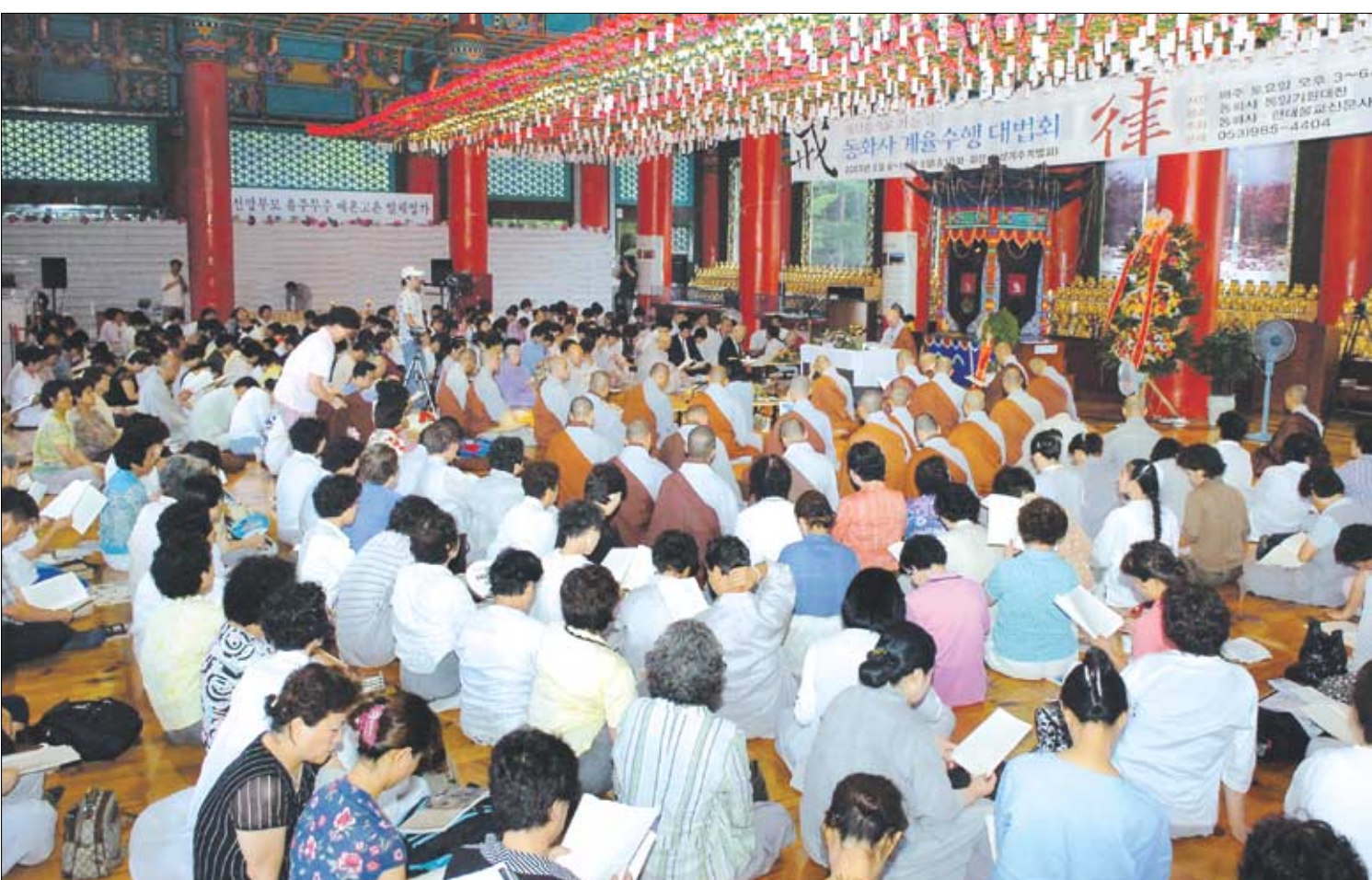
계율에 대한 바른 이해와 실천으로 깨달음의 길을 닦아가기 위해 8월6일 동화사 통일기원대전에서 열린 계율수행 대법회 입제식에는 1500여 사부대중이 동참 진지한 법석을 이뤘다.

동화사 계율수행대법회는 계율 수행을 주제로 한 최초의 대중 법회다. 한국불교 최고의 율사스님들이