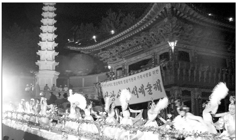
질월월석이었던 8월 9일, 부산 삼광사는 질석예술제를 열어 가족사랑을 되새기고 APEC 성공기원을 기원했다.

미국, 중국, 일본, 러시아 등 21개국 정상들이 부산을 찾게 되는 APEC 정상회의가 8월 10일 현재 100일 앞으로 다가왔다. 부산시가 APEC 정상회의의 체제로 돌입한 것을 비롯 불교