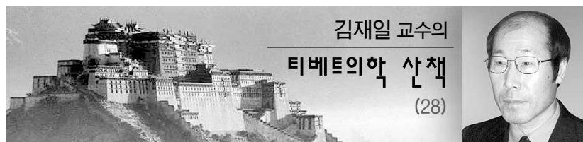
김재일 교수의 티베트의학 산책 (28)