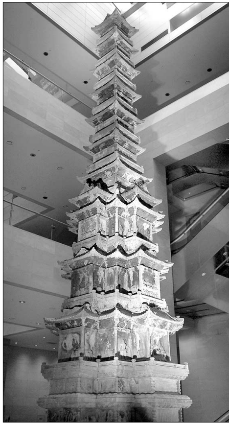
국립중앙박물관 동관 ‘역사의 거리’에 세워진 국보 제86호 경천사10층석탑