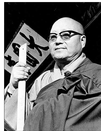
탄허 스님은 동서양의 정신문화를 넘나드는 최고의 대강백으로 불교계는 물론 일반 사회에서도 존경을 받았다.

그러나 우담거사 혼자 힘으로 아무도 기억하지 않았던 역사를 되짚어 내는 것은 불가능에 가까워 보였다.