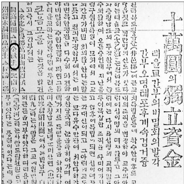
심민원의 독립자금을 모금했다 발각됐다던 당시 동아일보 기사(왼쪽)와 경성복심법원의 재판 결과를 담은 문서를 통해 김홍규 선생의 독립운동 행적을 발견할 수 있다.

광복 60주년을 맞아 탄허 스님의 부친 김홍규 선생(1888~1950)의 독립운동 사실이 새롭게 조명되고 있다.