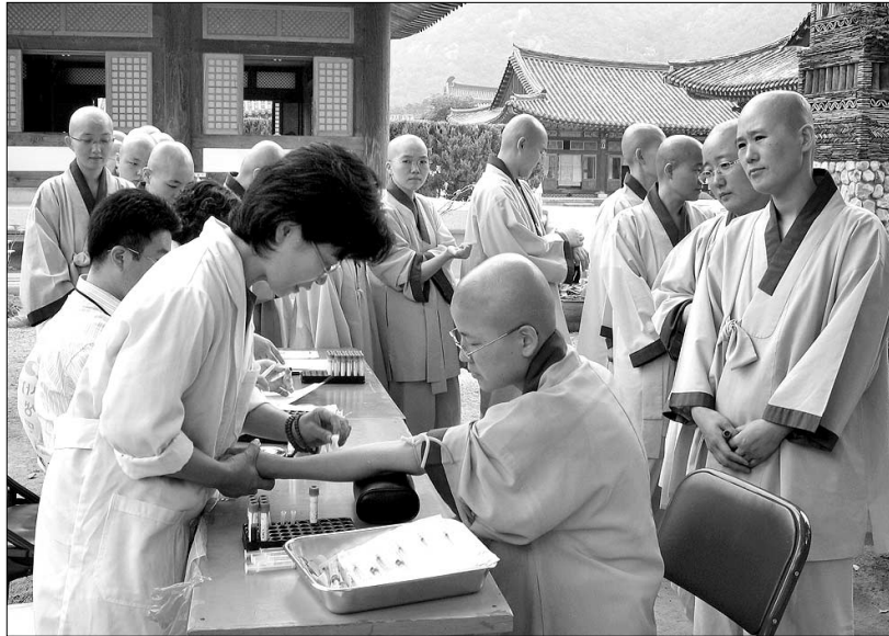
운문사 학인 스님들이 채혈을 하고 있는 모습.

“생명보시로 부처님 법 실천합니다.” 7월 24일 청도 운문사(주지 흥륜) 가만히 있어도 땀이 흐를 정도의 무더위에도 학인 스님들이 길게 줄을 늘어섰다. 생명나눔실천본부(이사장 법장)가 운문사에서 펼친 골수기증 희망자 등록과 장기기증회원등록 캠페인에 참여하기 위해서다.