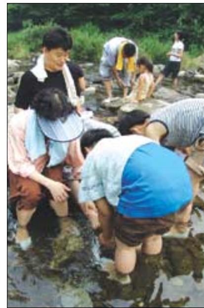
존경과 사랑의 마음을 담아 아버지의 울퉁불퉁한 발을 씻겨주는 가족들.

있다는 사실을 그림을 통해 알게 된 것이다. '사랑' 가족의 평화씨는 "가족의 장단점을 생각해보는 동안, 새삼 소중함을 느끼게 됐다"고 말했다.