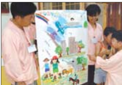
"우리가족은 '여행을 좋아하는 가족'이에요" 가족의 특징을 그림으로 그려서 설명하는 아이들.