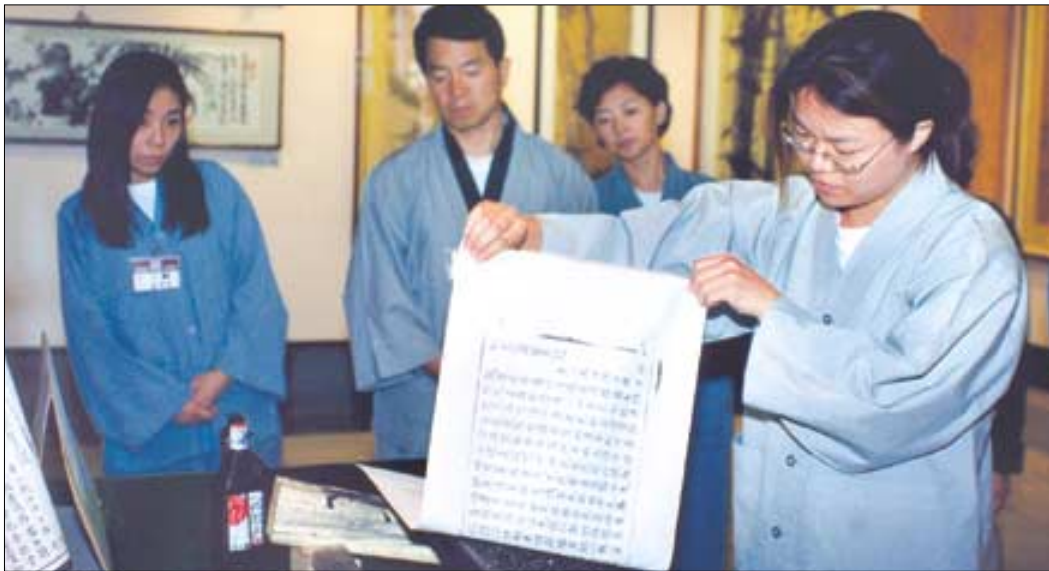
신행단체들이 템플스테이를 위한 프로그램으로 활용하기 위해서는 단체의 특성을 살린 프로그램을 기획하고 준비해야 한다. 사진은 합천 해인사 템플스테이에서 인경을 배우고 있는 직장인들.