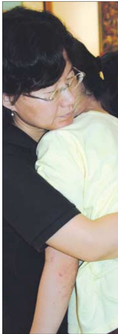
"사랑한다, 내 딸아." 진심을 다해 자녀를 끌어안으며 귀에 속삭여본다.