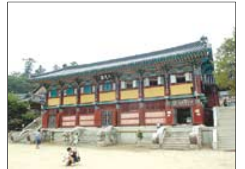
해인사 종합홍보관이 있는 구광루.