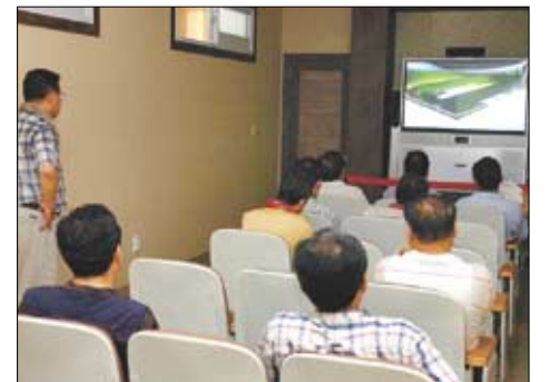
팔만대장경과 판전을 소개하는 영상물을 보고 있다.