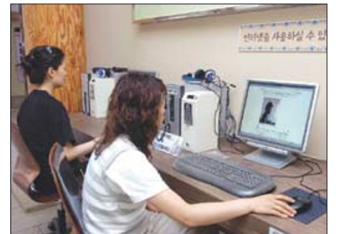
인터넷을 통해 해인사 홈페이지를 둘러보는 참배객들.