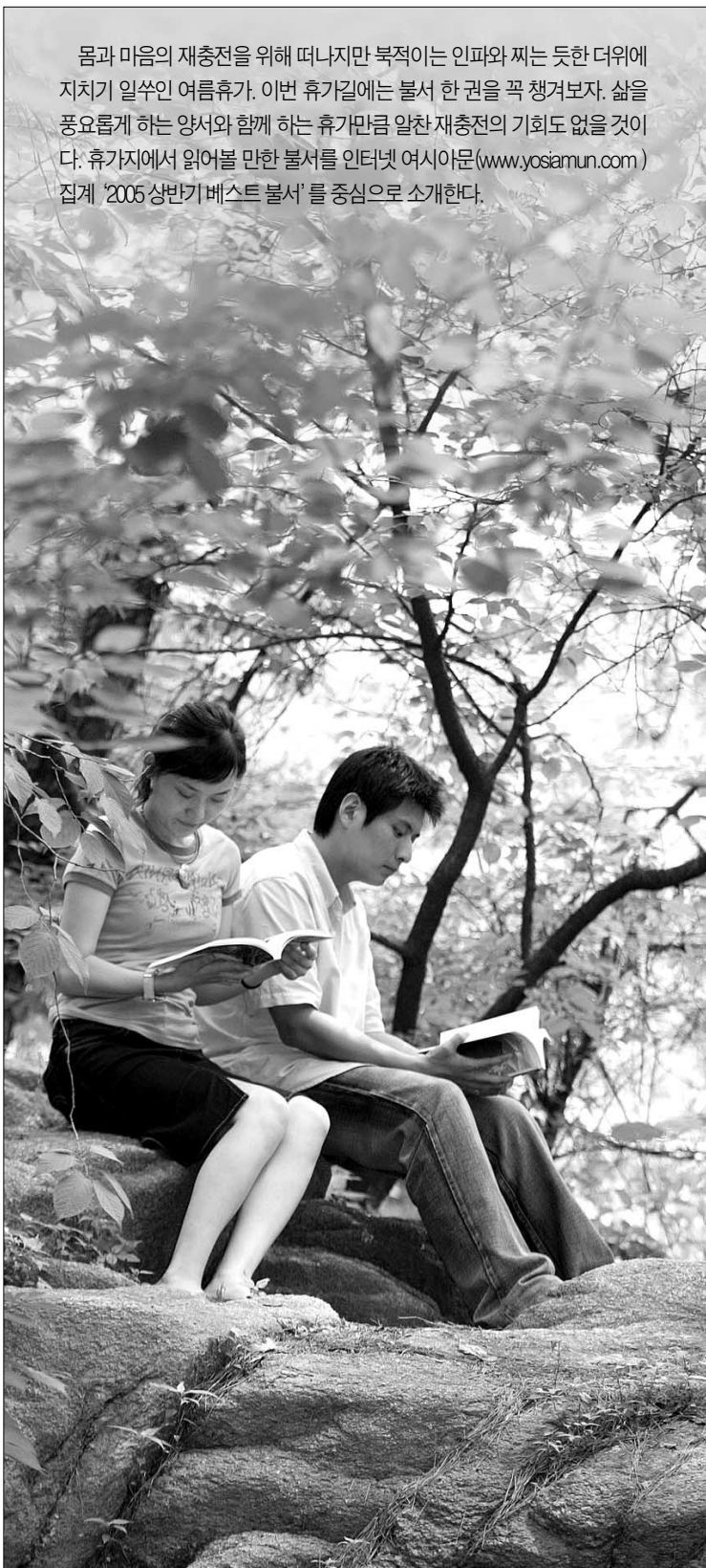
휴가 기간, 시원한 계곡이나 산사에서 읽는 한권의 불서는 마음을 살찌우는 양식이 된다.

몸과 마음의 재충전을 위해 떠나지만 복작이는 인파와 찌는 듯한 더위에 지치지 일주일 여름휴가. 이번 휴가길에는 불서 한 권을 꼭 챙겨보자. 삶을 풍요롭게 하는 양서와 함께 하는 휴가만큼 일한 재충전의 기회도 없을 것이다. 휴가지에서 읽어볼 만한 불서를 인터넷 여시아문(www.yosiamun.com) 집계 '2006 상반기 베스트 불서'를 중심으로 소개한다.