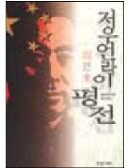
저우언라이 평전 리핑지음 | 허유영 옮김 한얼미디어 | 2만5천원

<저우언라이 평전>은 사후에도 ‘영원한 인민의 빛’으로서 중국 인민들의 존경을 받고 있는 저우언라이의 일대기를 충실하게 담아낸 역작이다. 지은이는 풍부한 문헌자료와 당대 저우언라이와 교류했던 수많은 사람들의 기록들을 통해 저우언라이의 일생을 밀도있게 재구성했다.